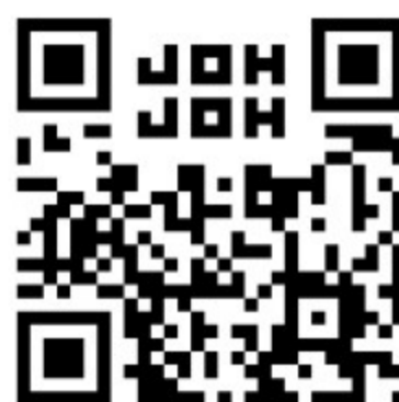
上条町内会 ホームページ