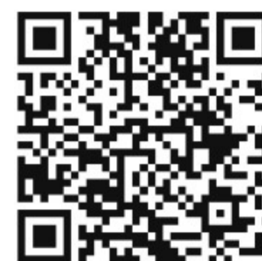
公民館 予約状況ページ